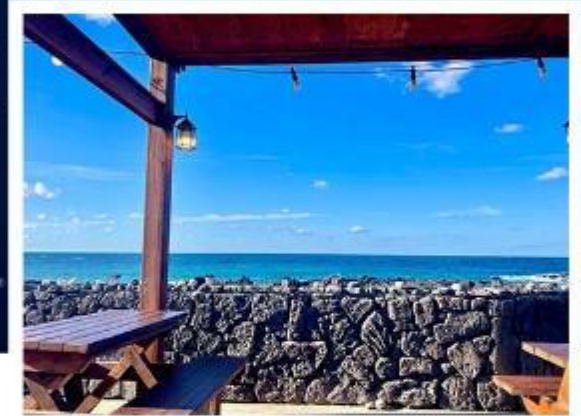
超級海景霸氣龍蝦之家 (兩人一隻+炒飯)