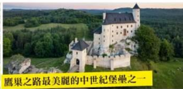
鷹巢之路最美麗的中世紀堡壘之一