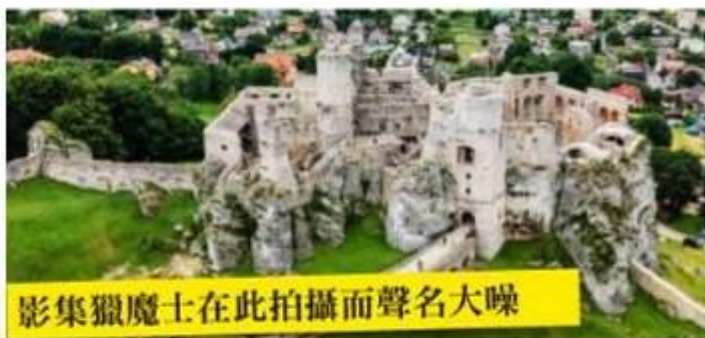
影集獵魔士在此拍攝而聲名大噪