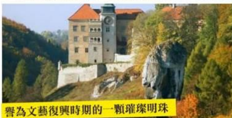
譽為文藝復興時期的一顆璀璨明珠

波蘭最負盛名的鷹巢之路，位在科拉科夫及琴斯托霍瓦之間的侏儸紀高地上，這裡的岩層大多形成於侏儸紀時期，當時這片區域被海洋覆蓋並經歷了數千年喀斯特地形作用在這片狹長的高地，造就了如今壯麗的石灰岩石柱、懸崖及洞穴，遍佈在風景如畫的山谷之中，由於這片高地倚靠著汝拉山脈，在中世紀時期為波蘭王國及捷克王國的邊界屏障，自古以來便是戰略要地，14世紀波蘭國王卡西米揚大帝下令修建要塞及城堡，如今仍可見25座城堡、瞭望塔聳立在陡峭的懸崖上，宛如老鷹的巢穴因而得名。