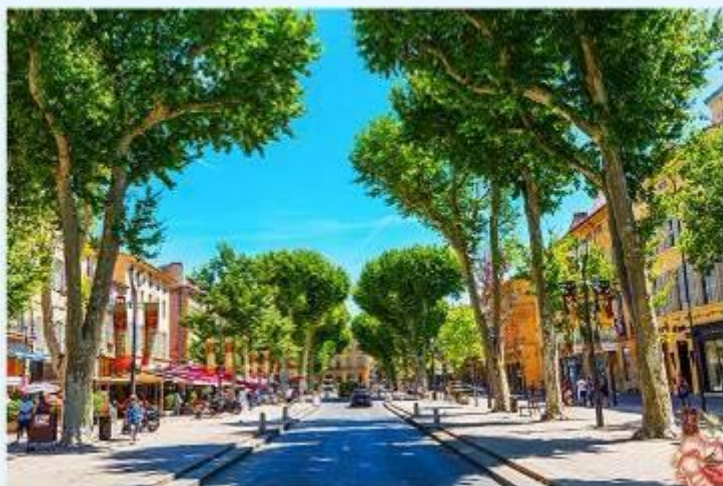
Aix en Provence