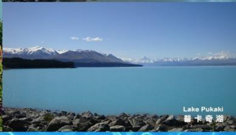
Lake Pukaki 普卡奇湖