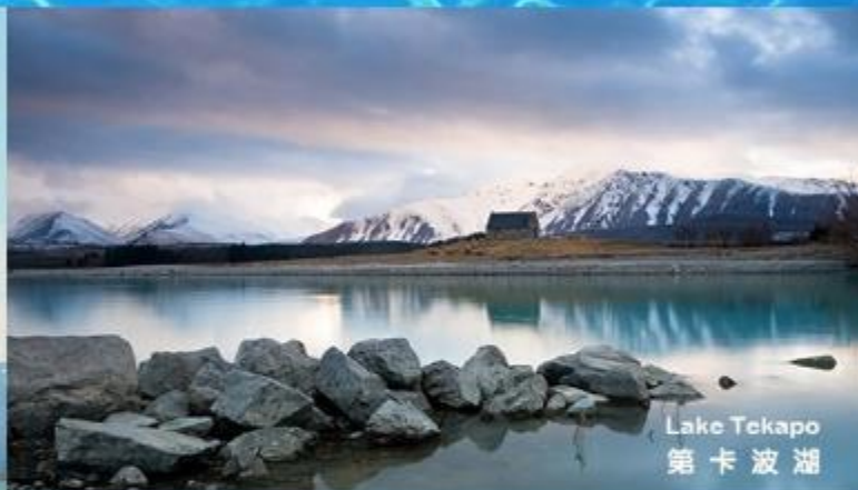
Lake Tekapo 第卡波湖

海拔3,764公尺的庫克山，被稱為「南阿爾卑斯山」，附近環繞著塔斯曼山等18個3,000公尺以上的高山。在國家公園區內有兩座美麗的冰河湖，在壯麗山景和湖景的襯托下交織出不凡的美景，如同置身風景畫中，是南島必遊景點。